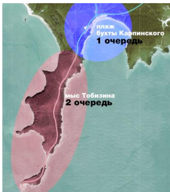
Рис. 4. Очередность застройки

Схема очередности застройки территории предполагает деление благоустройства на две очереди, так как они являются отдельными зонами с большим туристическим потенциалом (рис. 4).