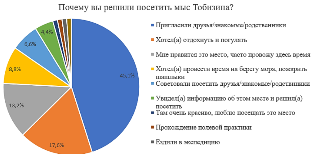
Рис. 1. Результаты опроса населения о причинах посещения

Для определения востребованности применения подхода к облагораживанию туристских троп выбран мыс Тобизина на острове Русский в г. Владивостоке. Проведен опрос среди жителей города о причинах посещения мыса, результаты представлены на рисунке 1.