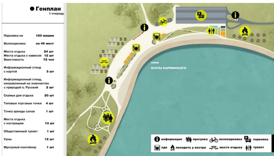
Рис. 5. Генплан первой очередности застройки Fig. 5. General plan of the first stage of development

В рамках второй очереди планируется облагораживание тропы, проходящей непосредственно по всему мысу: от основания до конца общей протяженностью 3 километра, которое будет включать в себя видовые площадки, места отдыха, безопасные зоны для фотосъемок, информационные указатели, а также другие удобные опции для посетителей (рис. 6). Все это позволит привлекать в край не только жителей близлежащих территорий, но и гостей города и даже пожилых людей и лиц с ограниченными возможностями. Причем велика вероятность того, что в последующем гости города станут его жителями с учетом открывающихся возможностей.