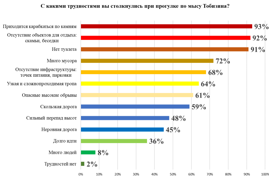
Рис. 2. Результаты опроса населения о возникающих трудностях

По вопросу в части возникающих сложностей во время посещения мыса Тобизина, результаты опроса представлены на рисунке 2.