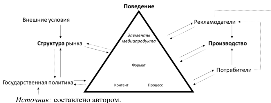
Рис. 3. Пересмотренная SCP-модель медиарынка.

На рис. 3 представлена модифицированная SCP-модель, дополненная двумя группами пользователей и тремя элементами медиапродукта, обсуждавшимися ранее. Эта новая модель содержит наиболее важные характеристики медиарынка, а её основные концепции находят своё отражение в модели трёхстороннего рынка (Варганов, 2020, 2021).