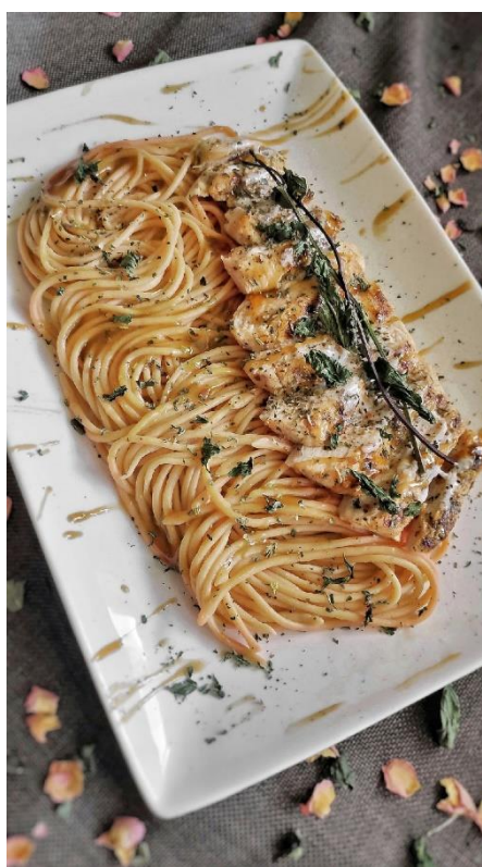
Рис. 3. Пример использования натурального красителя

Для получения максимально эффективного натурального красителя овощное пюре должно содержать наибольшее количество красящих веществ и иметь наивысшую кислотность. В связи с этим мы выбираем методику СВЧ-нагрева, с помощью которого изготавливаем овощное пюре для дальнейшего применения в пасте.