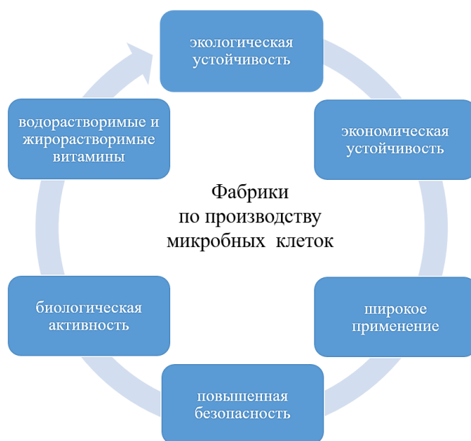
Рис. 1. Основные преимущества процесса микробной ферментации для производства витаминов

цине и других областях, способствуя доступности необходимых питательных веществ для различных целей; (г) повышенная безопасность и биологическая активность — витамины, полученные с помощью процессов зелёной ферментации, могут обеспечить повышенную безопасность, биологическую активность и скорость усвоения по сравнению с витаминами, синтезированными традиционными методами; (д) водорастворимые и жирорастворимые витамины — методы зелёного производства охватывают широкий спектр витаминов, включая водорастворимые витамины (такие как витамины группы В и витамин С) и жирорастворимые витамины (такие как Е и К). В целом, производство “зелёных” витаминов с использованием фабрик микробных клеток предлагает устойчивый и экологически чистый подход к удовлетворению глобального спроса на необходимые питательные вещества.