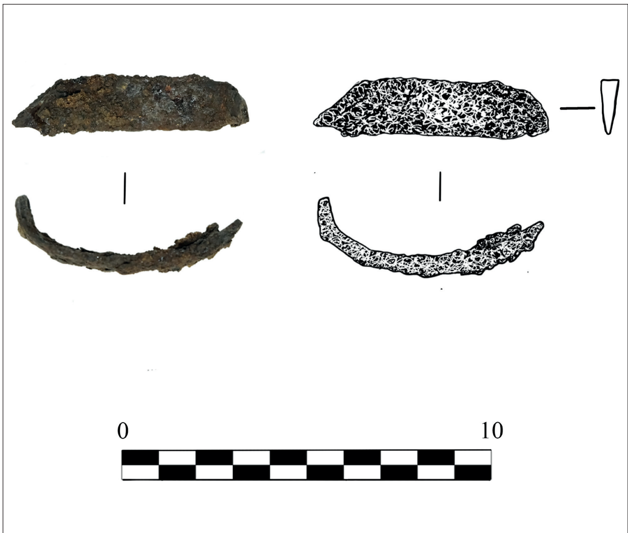
Рис. 4. Железное лезвие инструмента из погребения Мамыкан

Состояние костяка и относительно небольшая глубина могильной ямы дают основания датировать погребение XVII – началом XVIII вв. Внутримогильные сооружения в виде