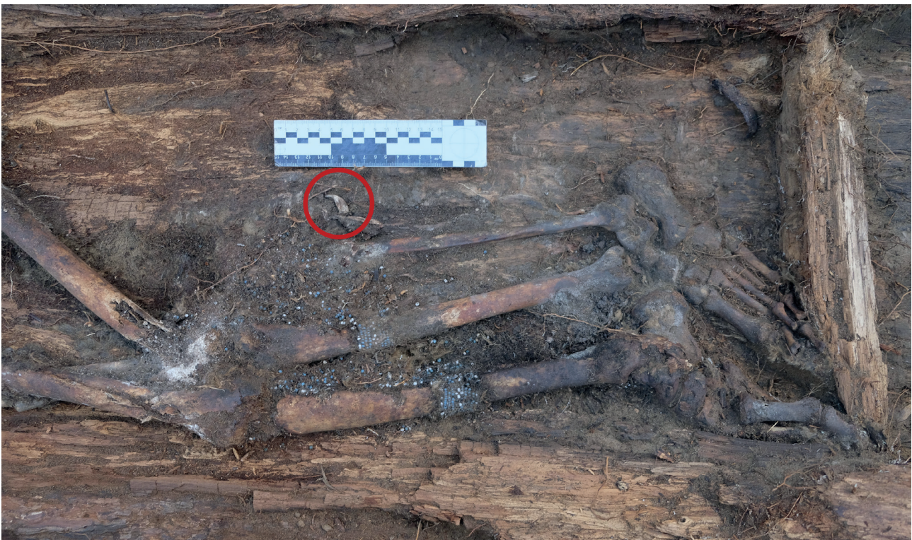
Рис. 2. Погребение Мамыкан. Положение ног погребенной. Красным кругом отмечен коготь медведя

Под правой бедренной костью были обнаружены ножны без ножа, состоящие из берестяной основы и деревянного вкладыша (Рис. 3). Берестяной чехол имеет вид удлиненного прямоугольника, расширяющегося к устью. Длина ножен 21,3 см; длина широкой части 9,2 см. Высота узкой части 2,5 см, широкой части – 4,2 см. В сечении ножны имеют каплевидную форму, острой частью вниз. На нижней части приустьевой широкой стороны имеются два овальных отверстия для продевания подвеса. Размеры отверстий: высота – 0,6 см, ширина – 1–1,3 см. Устье также имеет каплевидную в сечении форму, ширина самой широкой части – 2,3 см; высота – 4,2 см. На поверхности