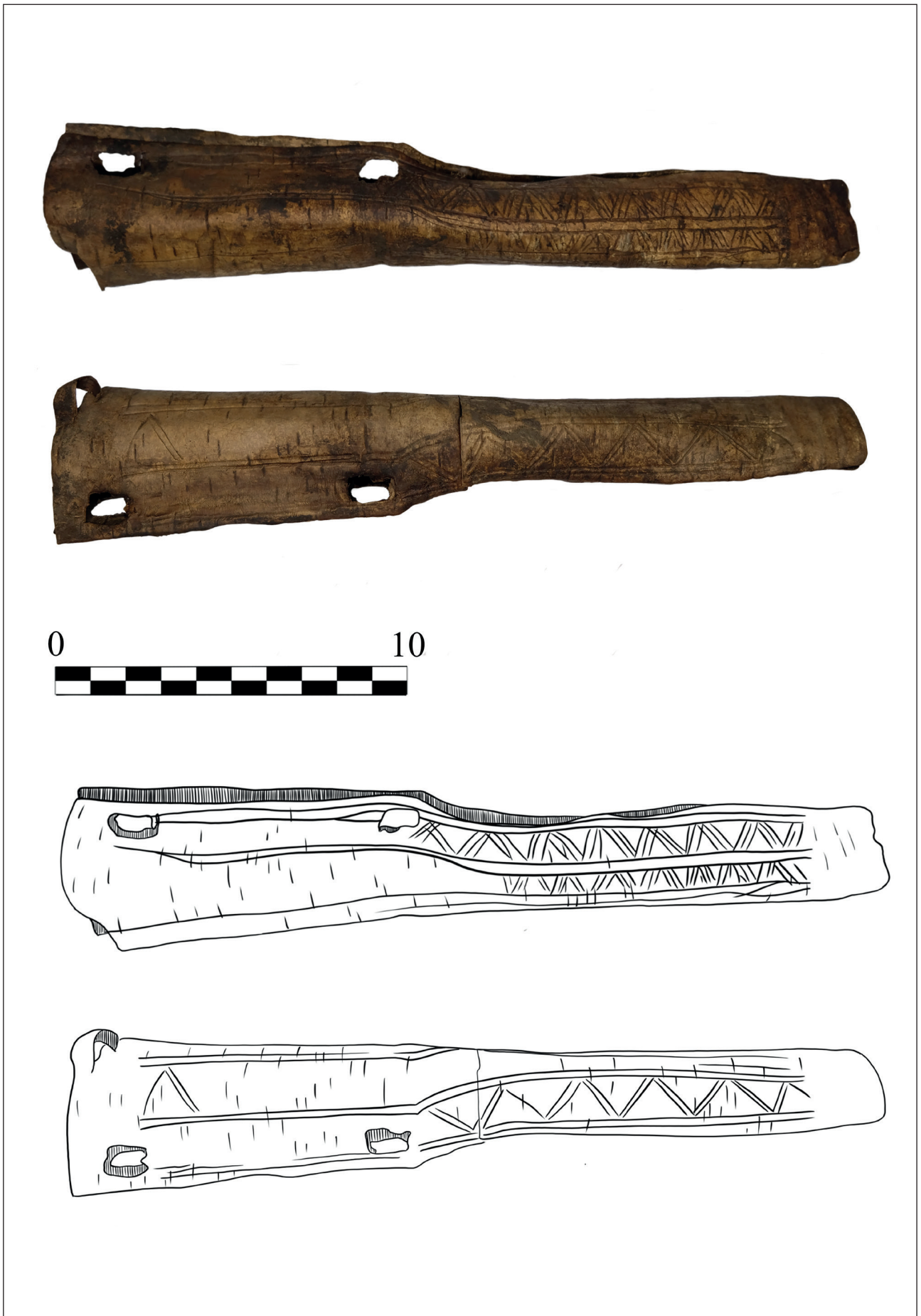
Рис. 3. Берестяные ножны из погребения Мамыкан