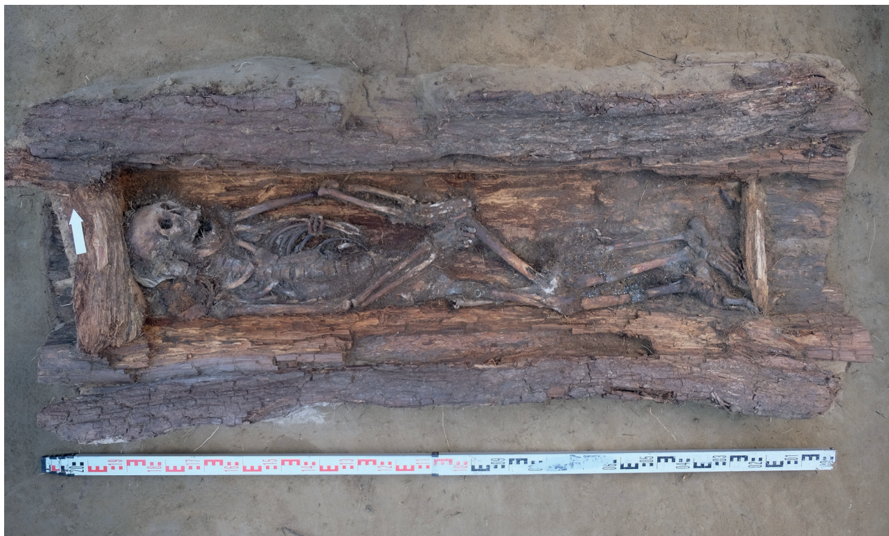
Рис. 1. Погребение Мамыкан. Общий вид

В гробу покоился костяк человека некрупного телосложения, на спине с завалом туловища