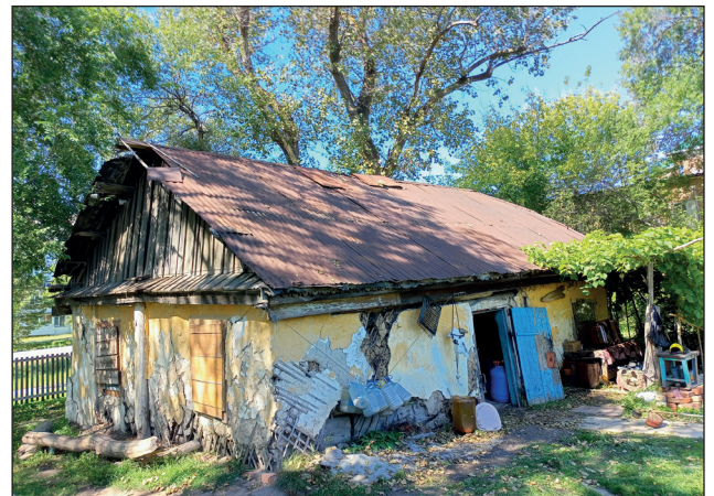
Рис. 3. Один из старейших домов с. Хороль Хорольского района Приморского края, датированный 1894 г.

В ходе полевого исследования, проведенного в 2022 г. в селе Хороль, нами был осмотрен, по всей видимости, старейший сохранившийся в нем дом. На его потолочной балке был вырезан крест и указан год постройки – 1894. В процессе строительства дома и его последующих перестроек были использованы разные материалы, включая бревна лиственных пород деревьев, лозу и дранку, которые с внешней стороны были обмазаны глиной. Такие дома местные жители называли мазанками (Рис. 3).