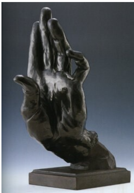
Рис. 4. Рука (бронза, 1918)

скульптуру и масляную живопись. Затем он учился в Нью-Йорке (1906), Лондоне (1907), Париже (1908), познакомился с такими известными мастерами, как Бернард Лич (1887–1979), «отец британской школы гончарного дела», Дж. Г. Борглум (1867–1941), учитель Такамура, создатель Рашморского мемориала. В 1909 г. он возвратился в Японию. Художественный стиль Такамура-скульптора был новаторским, отличался от традиционного японского искусства, свидетельствовал о влиянии западной скульптуры. Например, его работа «Рука» (рис. 4) отсылает к многочисленным изображениям рук О. Родена (1840–1917).