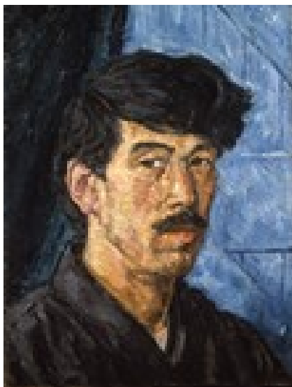
Рис. 1. Такамура Котаро. Автопортрет