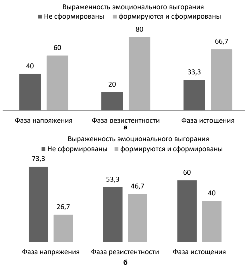
Рис. 2. Количество испытуемых (в %) с определенной выраженностью эмоционального выгорания, выявленных по опроснику В.В. Бойко: а) до проведения педагогического эксперимента; б) после проведения педагогического эксперимента

Было получено, что и по первой, и по второй методике среди учителей экспериментальной группы преобладают лица с той или иной степенью эмоционального выгорания (рис. 2).