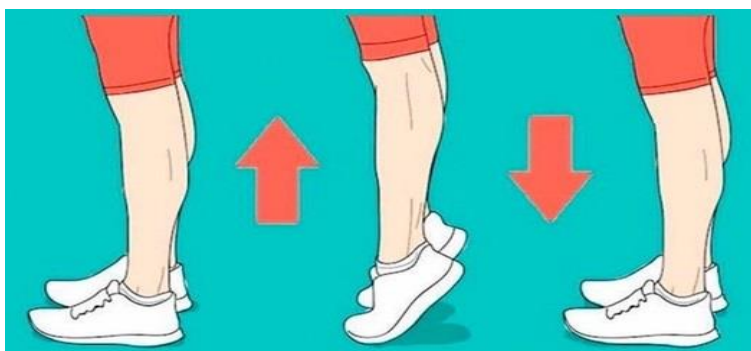
Рис. 1. Схема выполнения виброгимнастики А.А. Микулина Fig. 1. Scheme for performing vibration gymnastics by A.A. Mikulina

настикой. Это объясняется тем, что с помощью инерционных сил мы усиливаем обмен веществ в мозге: венозная, зашлакованная кровь энергичнее прогоняется вниз, а артериальная – вверх, к мозгу.